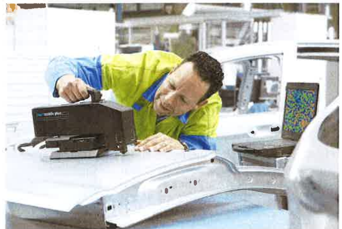
Bei verschiedenen Kunden im Karosseriebereich wurden mit dem „TCO Scan MagiZinc“ bereits Verbesserungen im Produktionsprozess quantifiziert.

Der TCO Scan MagiZinc gibt dabei den Messprozess vor: Zuerst wird die Oberflächenrauigkeit untersucht, um Abrieb festzustellen – also Metallpartikel, die an den Werkzeugen hängen bleiben und das Pressen nachfolgender Bleche beeinträchtigen. Anschließend identifiziert eine Wärmebildkamera kritische Teile der Anlagen mit hoher Reibung und daher hoher Werkzeugverschmut-